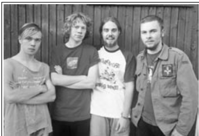
Die Siegerband „Herberts Achte“

Hallo kleine und große Leser, am 22.10. fand im Bürgersaal der 1. Nöbdenitzer Amateurbandwettbewerb statt. Ca. 250 Fans unterstützten lautstark ihre Bands. Am Start waren Sicario und § 323 A aus Schmölln, Plusminusnull aus Heyersdorf, Insanity's Fat Booty aus Heidelberg sowie die Lokalmatadoren Herberts Achte und Gehörsturz. Herberts Achte gingen nach Meinung der Jury und der Publikumresonanz als Sieger hervor, den 2. Platz teilten sich Plusminusnull und § 323 A. Herzlichen Glückwunsch noch mal und allen Bands lieben Dank für die Teilnahme.